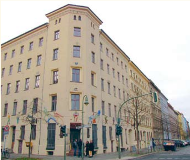
Denkmalgeschützte Fassade Adalbertstr. 79 / Waldemarstr. 46 (Berlin-Kreuzberg)