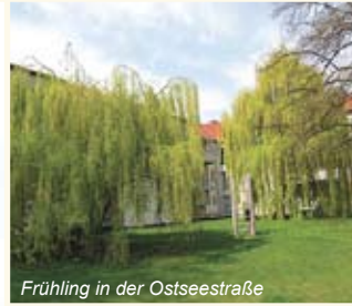
Frühling in der Ostseestraße