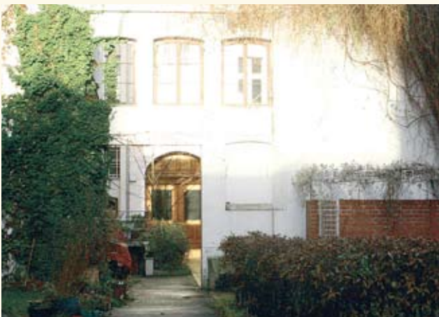
Adalbertstr. 73 (Berlin-Kreuzberg)

Zunächst ging es bei der Umfrage um die Mitgliederversammlung: Drei Viertel der Mitglieder besuchen regelmäßig oder gelegentlich die Mitgliederversammlung. Die Frage Was hat Ihnen bei der Mitgliederversammlung gut gefallen? beantworteten 50% der Befragten, dass sie zufrieden seien, über die finanzielle Lage der Genossenschaft informiert zu werden. Nahezu alle befragten Mitglieder sind zufrieden mit dem Ort und der Uhrzeit der Mitgliederversammlung. Ein Mitglied fand die Dauer der Mitgliederversammlung generell zu lang ( eine Stunde wäre besser ).