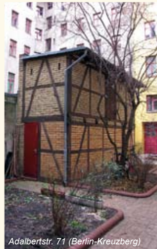
Adalbertstr. 71 (Berlin-Kreuzberg)

Der Aufsichtsrat wird von der Mitgliederversammlung gewählt. Die Amtsdauer beträgt drei Jahre und die Mitglieder des Aufsichtsrates müssen Genossenschaftsmitglieder sein.